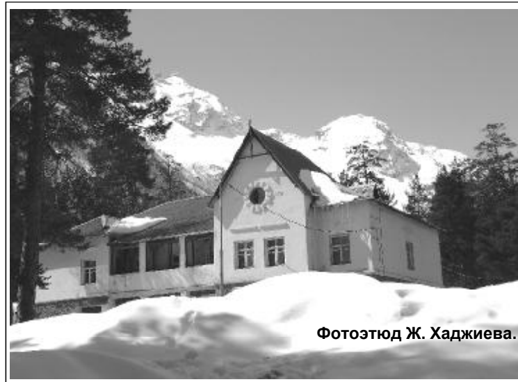
Фотоэтиюд Ж. Хаджиева.

настройтесь, что лечение длительное. Нужно время, чтобы препараты подействовали.